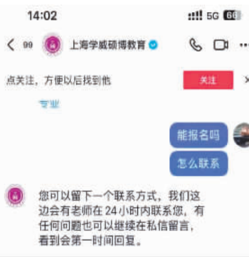
学威仍在平台招生。

学员报名西班牙武康大学“博士学位项目”的学费收据,加上手续费总计13万元人民币。