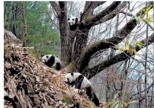
两只雄性大熊猫在“比武”,雌性大熊猫在树上旁观。

据新华社西安3月29日电 每年的三四月份是秦岭野生大熊猫一年一度“相亲大会”的会期。处于发情期的雄性野生大熊猫聚集小群,竞争异性的青睐。雌性大熊猫则旁观“求婚团”花式“秀肌肉”,从中选出“如意郎君”。