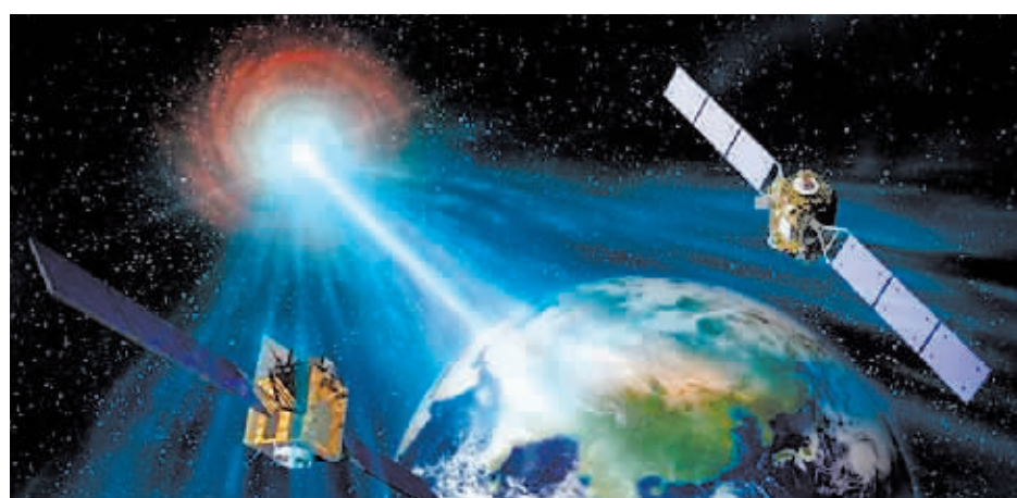
“慧眼”卫星和“极目”空间望远镜观测迄今最亮伽马暴示意图。

“本次‘慧眼’和‘极目’的观测研究对于深入理解伽马暴这种极端宇宙爆发现象提供了崭新视角。”张双南说。