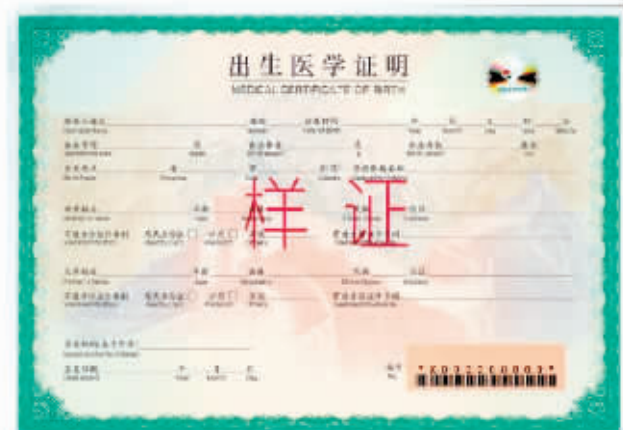
出生医学证明(第七版)样证式样。

新华社北京3月29日电 出生医学证明(第七版)将于4月1日起启用。记者近日从国家卫生健康委了解到,为保障新版证件和旧版证件顺利交替,国家卫生健康委、公安部联合印发《关于启用出生医学证明(第七版)的通知》,明确新版出生医学证明启用及旧版的清理销毁等相关要求。