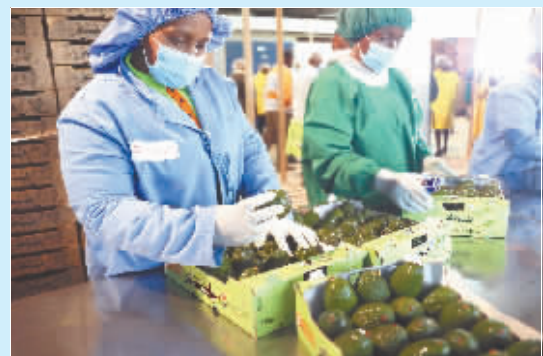
非洲鲜食牛油果出口中国。