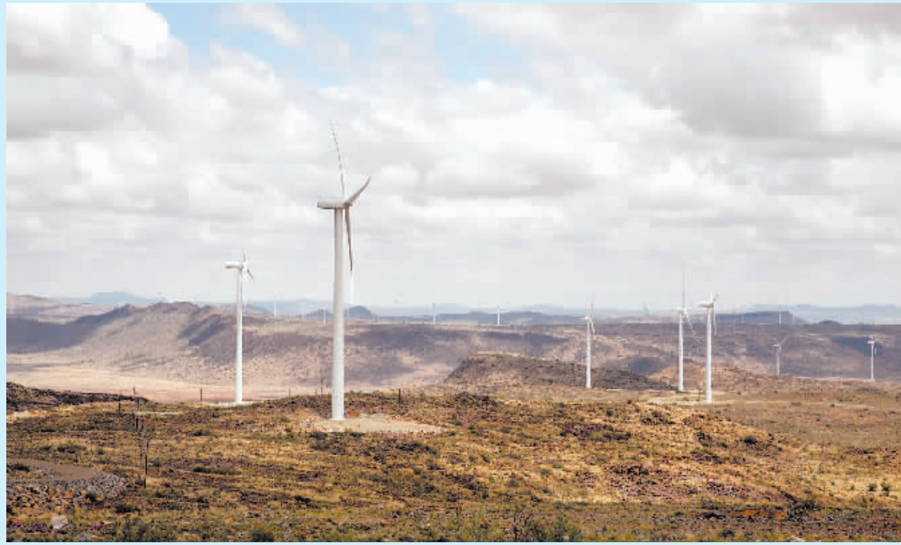
在南非北开普省德阿镇拍摄的中国龙源电力集团南非公司运营的德阿尔风电项目风机。