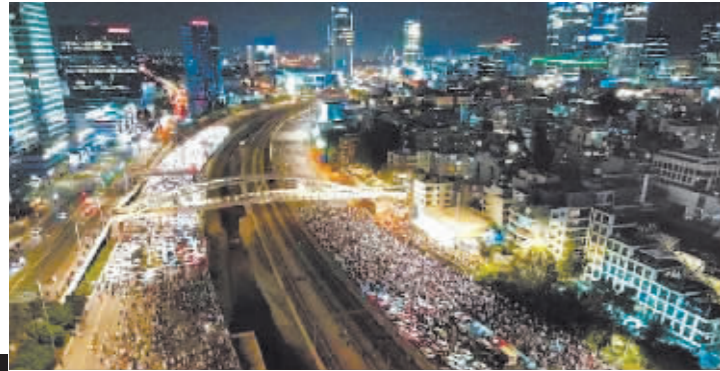
以色列人走上街头,抗议以色列总理内塔尼亚胡解雇国防部长加兰特。

以色列总理本雅明·内塔尼亚胡26日解除国防部长约亚夫·加兰特职务,引发多地大规模示威,把近期针对政府执意推动司法改革的抗议活动推向新的高潮。