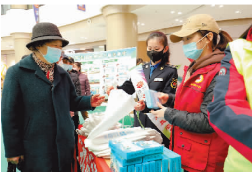
志愿者现场发放宣传册并解答相关问题。

志愿服务主要倡导节水优先、空间均衡、系统治理、两手发力,践行公民节约用水行为规范、加强公众节水宣传,全面建设节水型社会。此次法治宣教分别在群力银泰城商场和群力家园小区进行。道里区综合行政执法局法制科、住建大队、群力街道办事处开展的60余名志愿者现场分发了“防止水环境污染保障管网设施安全”宣传册,通过讲解的方式告诉群众什么是排水户、排水户注意事项、排水户红线行为、排水户违法后果,并制作了标有“世界水日”“中国水周 节水中国 你我同行”的纸盒及布袋等公益普法纪念物。执法人员和律师现场对《城镇污水排入排水管网许可管理办法》进行了宣