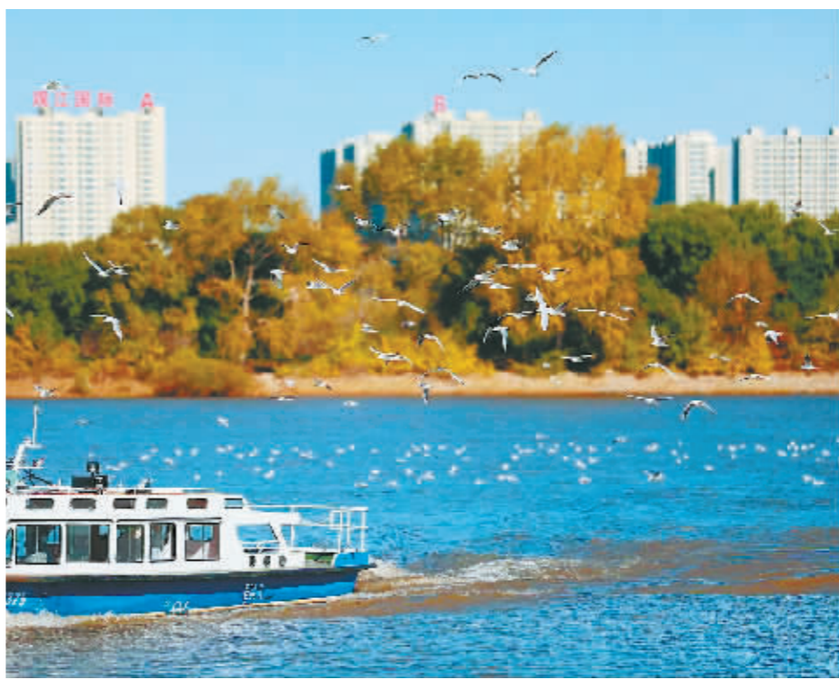
松江生态美,江鸥恋冰城。(本报资料片)

活动现场,黑龙江省文化和旅游厅向全球媒体发出邀约,真诚地欢迎大家来黑龙江避暑养生、赏冰乐雪、休闲度假,亲身感受黑龙江独特的魅力。