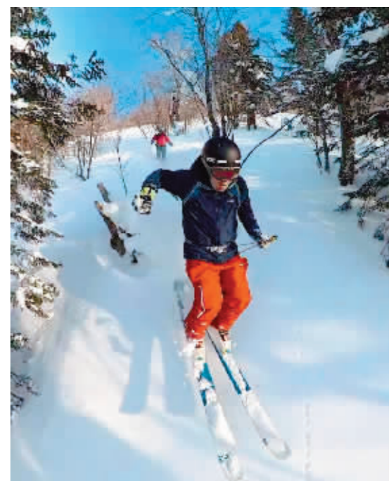
雪友滑野雪体验雪上飞驰的感觉。

春节之后,只有黑龙江和新疆滑雪场照常营业,而且可以一直滑到五六月份。“许多野雪爱好者更偏爱黑龙江的粉雪。”“公爵”说,黑龙江林子密,下雪后雪存留时间长,雪感佳,用我们的话说就是像面粉一样,所以叫粉雪,体验感更好。