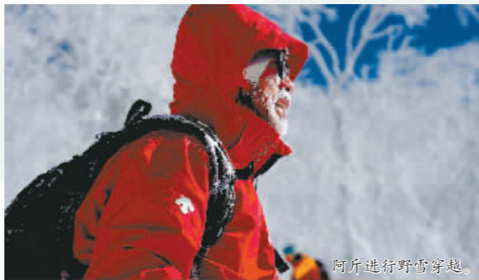
阿斤进行野雪穿越。