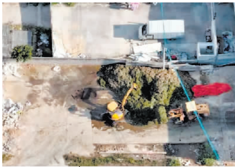
芥菜堆积在地上,周边环境脏乱。

14日晚9时许,当地质监部门对涉事企业进行突击检查,对相关产品抽样检查和查封处理。下一步将根据调查结果依法处理。