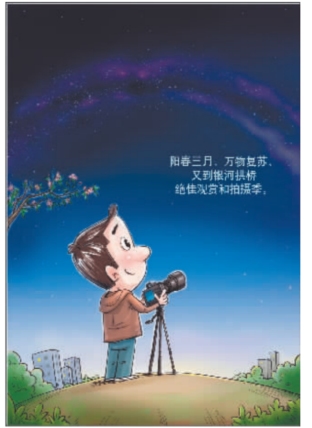
阳春三月,万物复苏,又到银河拱桥绝佳观赏和拍摄季。