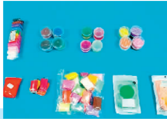
记者送检的彩泥样品。