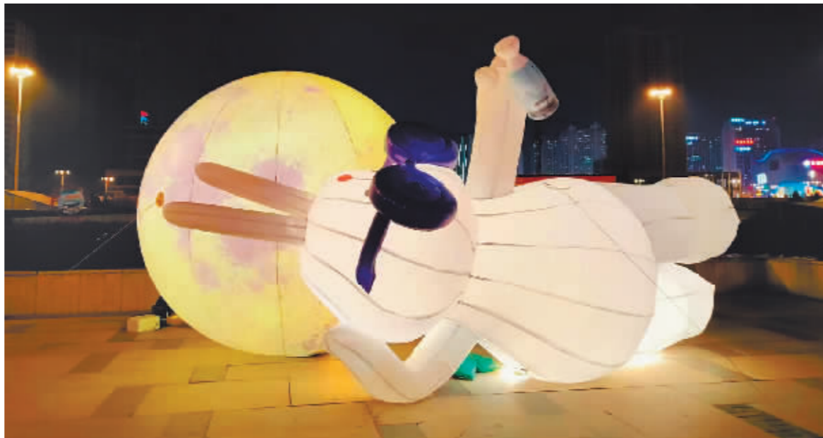
哈西站前创意十足的“邀月兔”。

“快来哈尔滨找兔子吧”“星空兔来龙塔了,哈尔滨这座城从不缺浪漫”“如果南岗区还有其它兔子,请踢我一脚,去打卡”“这兔子是趴在我家附近吗,明天就去找你”……系列唯美时尚的“星空兔”一经亮相,便迅速成为网络“红人”,赚了广大网友的好奇心,瞬间出圈网络。更有网友兴致勃勃开始全网蹲守,只为和最新出现的“星空兔”来张“热乎”的合照,在这个冬日,解锁“星空兔”,成为冰城新时尚。