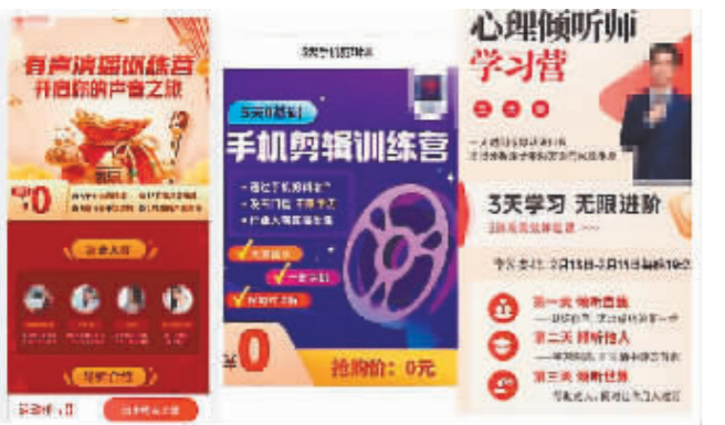
多个知名网络平台上都可见副业培训的引流广告。

有不少求职者参加此类培训班,记者参加的多场线上直播课参加成员超过千人,其中不少人急于求职或当前求职不大顺利。