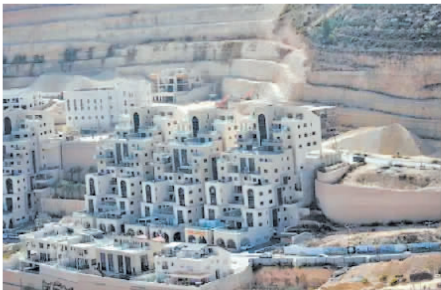
约旦河西岸的犹太人定居点。

就以色列政府为扩建约旦河西岸犹太人定居点出台的新举措,美国、英国、法国、德国、意大利以及加拿大政府14日发声反对,敦促相关各方避免采取可能导致地区局势升级的单方面行动。