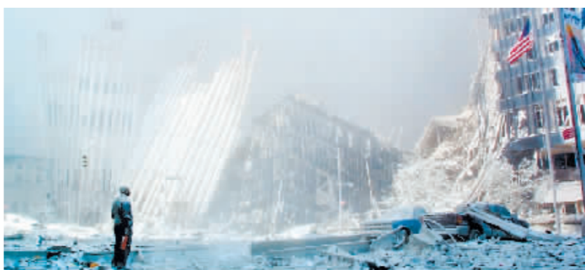
纽约世贸大厦2001年9月11日遭恐怖袭击倒塌后的资料照片。

30日宣布其首领阿布·哈桑·哈希米·库莱希同年10月战死,这一极端组织由谁掌控也成疑。库莱希是该组织一年内死亡的第二个头目。“‘伊斯兰国’宣布新头目叫阿布·侯赛因·侯赛尼·库拉希,其人真实身份仍未可知。”