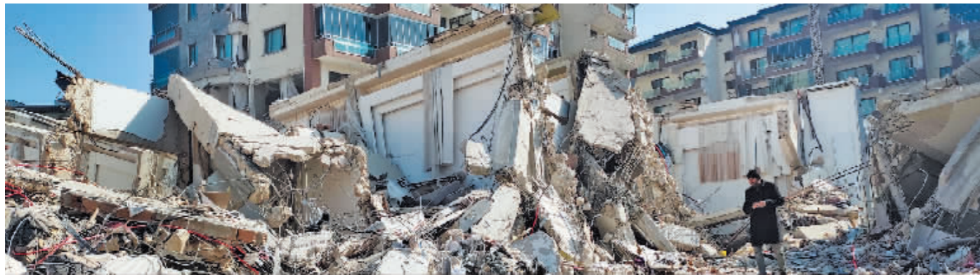
在土耳其哈塔伊省安塔基亚市,一名男子走在地震后的废墟上。