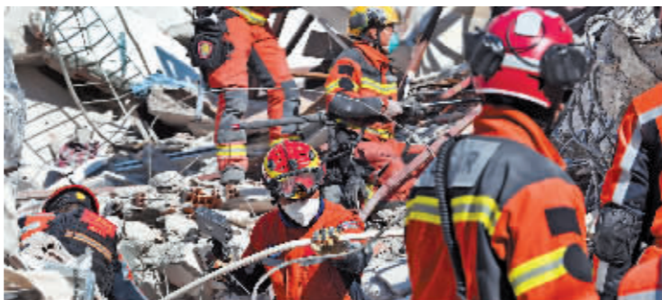
中国救援队在灾区开展救援工作。

土耳其南部靠近叙利亚边境地区6日发生强烈地震,造成两国重大人员伤亡。土耳其总统埃尔多安14日晚说,地震已造成该国逾3.5万人死亡、超过1.3万人入院接受治疗。据德新社报道,土叙两国累计遇难人数已超过4万人。