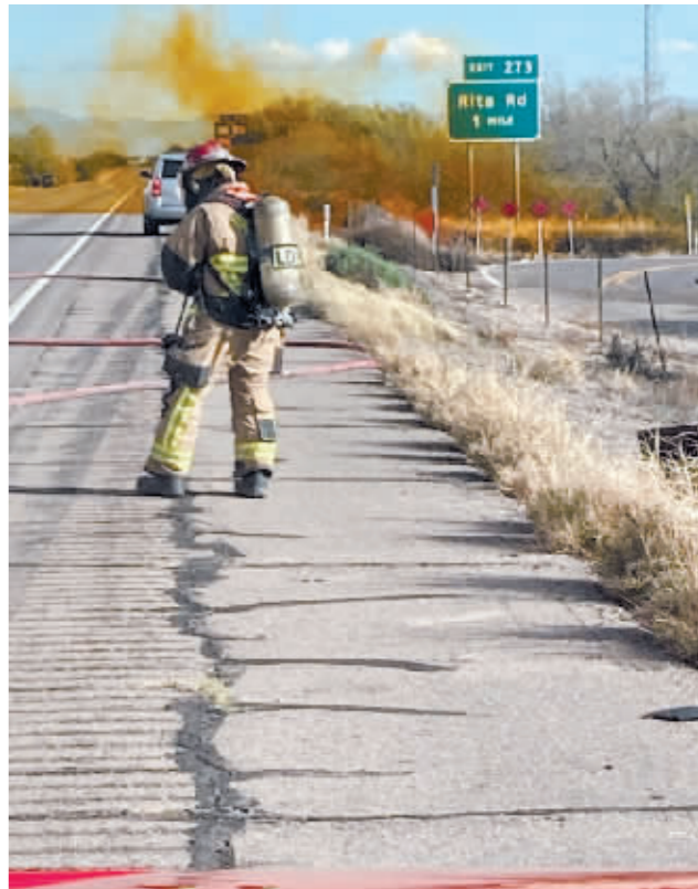
消防人员在发生事故的道路上工作。

据新华社电 美国亚利桑那州政府证实,一辆运送危险化学品的罐车14日下午在美国10号州际公路亚利桑那州境内路段侧翻,车上剧毒高腐蚀性硝酸泄漏,导致这条东西向交通动脉暂时关闭。