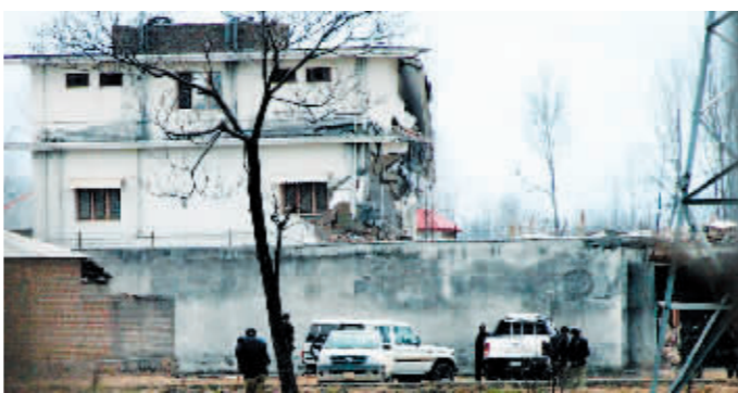
2012年2月26日,在巴基斯坦西北部的阿塔巴德,巴基斯坦警方在本·拉丹藏身处拆除现场警戒。

联合国一个专家小组新近呈交安理会一份关于恐怖组织“基地”的调查报告推断,赛义夫·阿德勒已手握“基地”组织领导权,接替去年死于美国无人机袭击的前任头目艾曼·扎瓦希里。