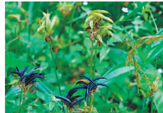
图为豆科植物新物种巴山黄耆的果。

新华社武汉2月14日电 我国科研人员在鄂西十堰市竹溪县和神农架林区发现了一种豆科植物新物种。相关研究成果近日已发表在国际期刊PhytoKeys上。