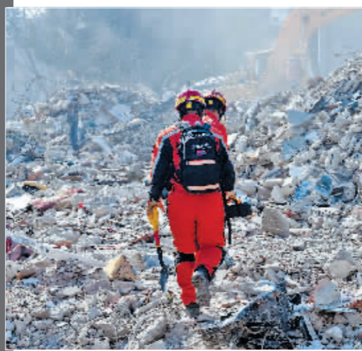
中国救援队队员在地震废墟开展救援。

员们不约而同鼓掌、握手、拥抱,互相竖起大拇指。9日,中国救援队与土耳其救援队通力合作,救出包括一名孕妇在内的三名女性幸存者。11日,中国救援队在安塔基亚市成功营救出第四名被困人员。中国救援队目前继续参与联合国救援组织区域救援协调中心工作,协调区域内队伍开展救援行动,并与新到达的救援队伍进行沟通接洽。