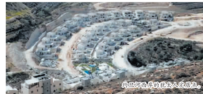
约旦河西岸的犹太人定居点。

个以政府批准建设的犹太人定居点,另有约100个“非法”定居点。据统计,截至今年1月1日,约旦河西岸犹太人定居点人口已经突破50万,一年间增幅超过2.5%,五年间增幅接近16%。上述数据不包括东耶路撒冷犹太人聚居区的逾20万人口。以色列新一届政府已将扩建犹太人定居点视为优先任务。巴以地区紧张局势近期明显加剧,耶路撒冷与约旦河西岸多地发生流血伤亡事件。舆论认为,以色列政府选择在此时大力推进犹太人定居点建设,将进一步刺激局势升级。(据新华社电)