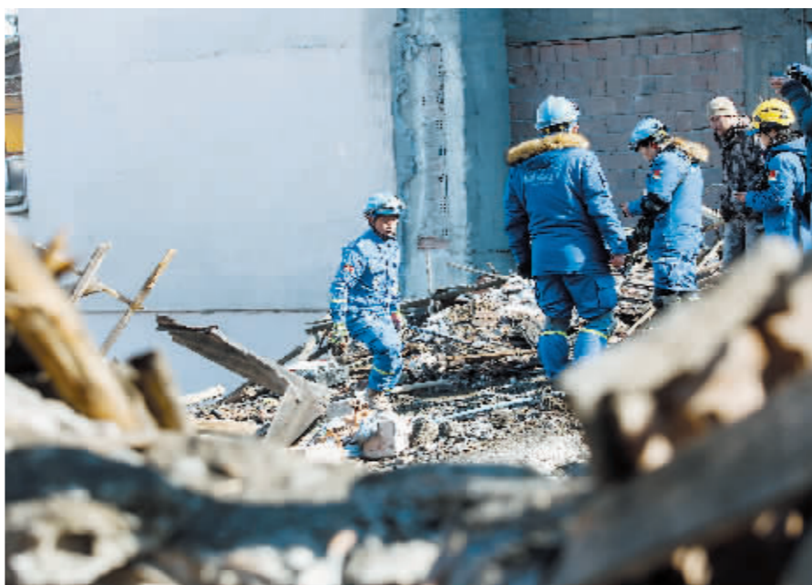
2月10日,中国蓝天救援队队员在土耳其马拉蒂亚省参与搜救。

近叙利亚边境地区6日发生的强震已造成该国超过2万人死亡;土耳其灾害与应急管理局发布数据显示,地震发生后累计余震1500余次,超过7.5万人从土耳其南部震区疏散,超过12万人参与境内震后救援行动。