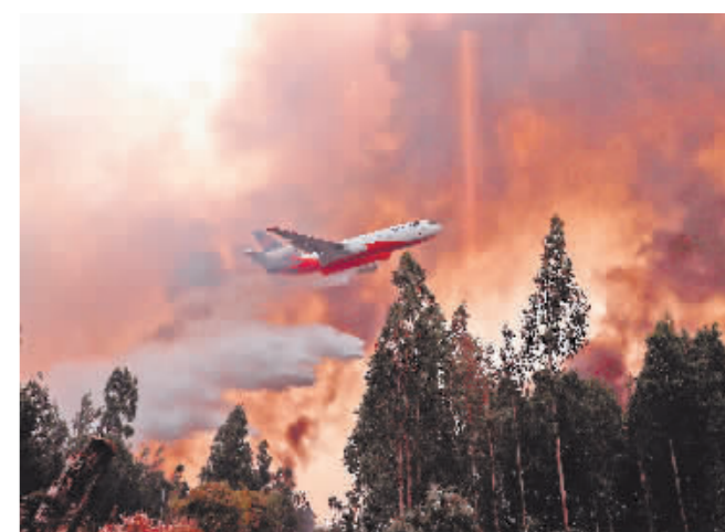
2月2日以来,智利中南部多地发生森林火灾。截至10日,火灾已造成至少24人死亡,受灾面积超过30万公顷,受灾人数总计5419人,1250处房屋被毁,94处火灾仍在扑救过程中。图为2月10日,一架飞机在智利宁韦进行灭火作业。