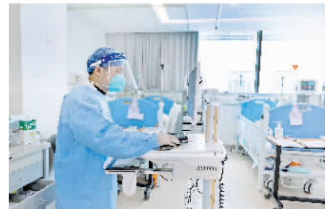
在上海交通大学医学院附属新华医院,儿科急诊医生在输入病例信息。

据新华社电 近期,全国新冠疫情日趋平稳,总体向好态势持续巩固。专家提醒,冬春季是各类呼吸道传染病的高发季,除了新冠病毒,一些其他病原体也会攻击人体的呼吸道和肺部,如流感病毒及人呼吸道合胞病毒等,也要做好防治。2月10日,中国疾控中心发布人呼吸道合胞病毒(HRSV)感染疾病防治知识问答,介绍HRSV病毒有关权威知识。