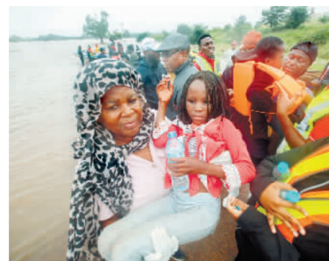
近日,莫桑比克首都马普托遇强降雨,部分地区发生洪涝灾害。2月11日,在莫桑比克首都马普托阿内地区,一名女子抱着女儿在救援人员带领下撤离洪灾地区。