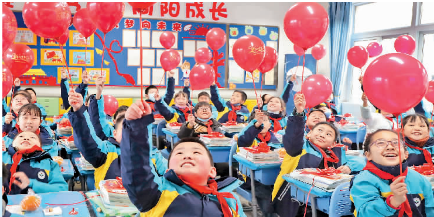
2月6日,浙江省杭州市桐庐县学府小学,学生在展示红色气球。

今年春季学期,是新冠病毒感染实施“乙类乙管”后首个学期。随着近日全国各地陆续进入开学季,师生们回到了阔别多日的校园。校园疫情防控的要求有哪些新变化?师生们的状态调整过来了吗?新学期的校园生活如何安排?