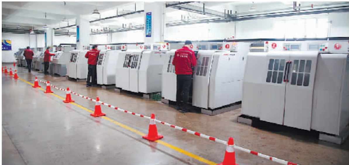
哈尔滨中村精密工具制造有限公司抢抓生产,一批批合金刀具销往国内外市场。