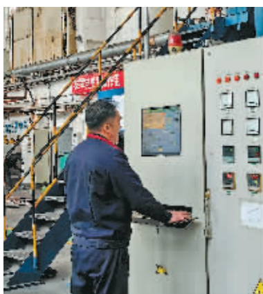
职工全力以赴忙生产。

本报讯(记者 张鸣霄 文/摄)新春以来,哈工投集团权属哈市地方国有工业企业的职工以饱满的热情在岗位上,确保订单如期交付,力保一季度“开门红”。记者从哈尔滨哈电碳厂有限责任公司了解到,近日,该厂全体职工紧锣密鼓保生产、保订单,加速推进“国和一号”主泵轴承石墨瓦胚件材料项目等重点科研项目进程。