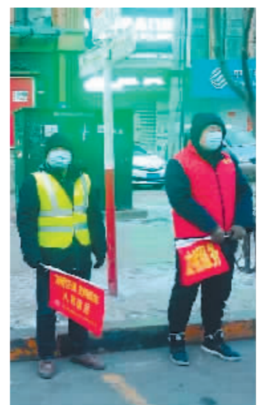
工作人员在站点监控客流情况。

本报讯(记者 刘希阳 文/摄)记者从市交通集团获悉,为了及时应对节后返城流、务工流、旅游流、学生流、短途流等不同群体、不同时段、不同区域的客流发展趋势,哈尔滨交通集团通过视频实时监控、人员上路监控等措施紧盯客流变化情况,即时优化线路运营组织。比如,2路公交车客流量较之前大幅增长,车队缩短了发车间隔,目前高峰期10分钟发一班车。