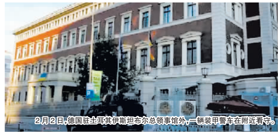
2月2日,德国驻土耳其伊斯坦布尔总领事馆外,一辆装甲警车在附近看守。

放狠话、召大使……近日,土耳其与欧美多国的外交争端再度升级。愤怒之中的土耳其给寻求加入北约的瑞典亮起了“黄灯”。分析称,至少在土耳其大选结束之前,瑞典“入约”进程或将停滞不前。