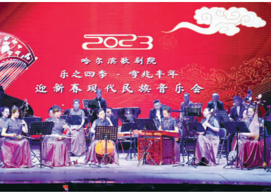
迎新春现代民族音乐会演出现场。

排练、装台、对光、走台……为确保“2023迎新春文化惠民演出季”在春节期间顺利上演,演艺影视集团艺术生产部工作人员及所有演职人员各司其职、不辞辛苦、认真工作,全体演员都铆足了劲儿,将欢声笑语送给每一位观众,为市民和游客送上丰富的精神“年货”。