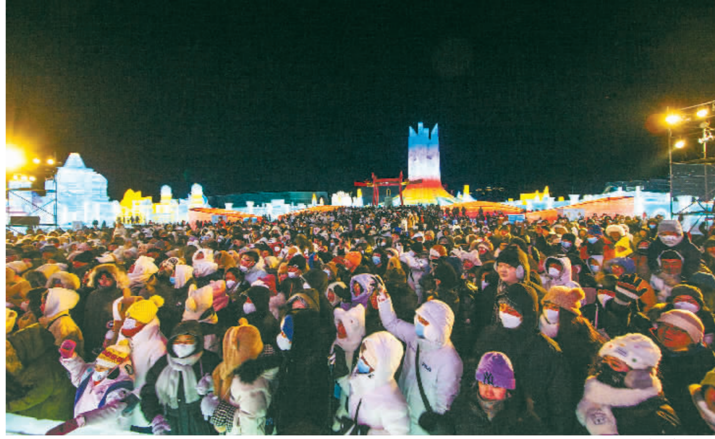
冰雪大世界游人如织。“哈报手机记者”宋雪梅摄

从客源消费看,春节期间,我市旅游市场客源结构明显优化,外地游客占48.6%,我市对外地游客吸引力显著增加。游客热门消费景区为哈尔滨冰雪大世界、哈尔滨松花江冰雪嘉年华、索菲亚教堂、波塞冬海底世界、哈尔滨极地公园海洋馆等。我市夜