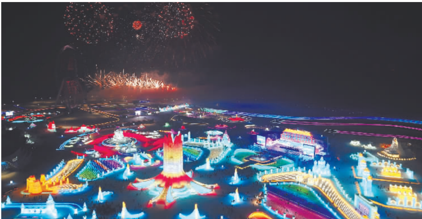
1月5日,冰雪节启幕焰火在冰雪大世界园区上空绽放。

“冰城”哈尔滨迎来冰雪旅游季,见证旅游消费日渐复苏。各类商家、平台抢抓时机推出多样化的促销活动,各地政府因势利导打造特色消费业态和场景。