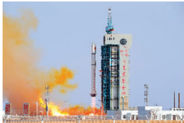
1月13日15时00分,我国在酒泉卫星发射中心使用长征二号丁运载火箭,成功将遥感三十七号卫星和搭载的试验二十二号A/B星发射升空,卫星顺利进入预定轨道,发射任务获得圆满成功。这次发射的3颗卫星主要用于空间环境监测等新技术在轨验证试验。