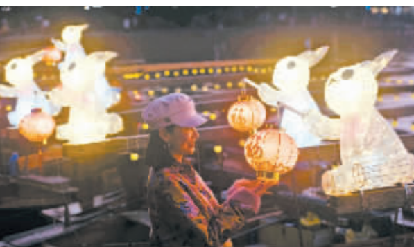
日前,30艘装有“玉兔灯”的手划船集中亮相杭州西湖,供市民游客乘坐、赏灯游玩,热热闹闹迎接新春佳节。