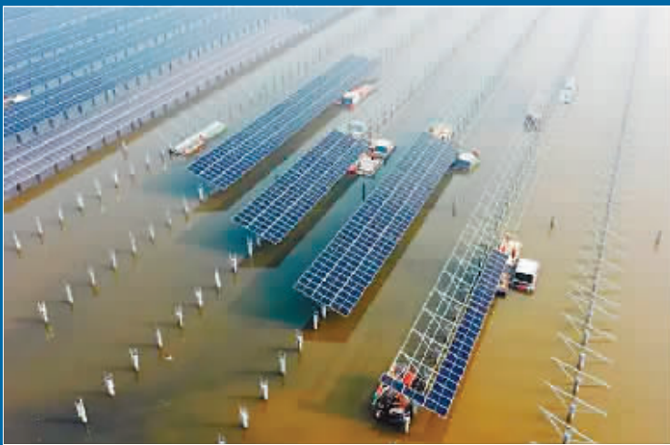
华电海晶光伏项目B标段现场。