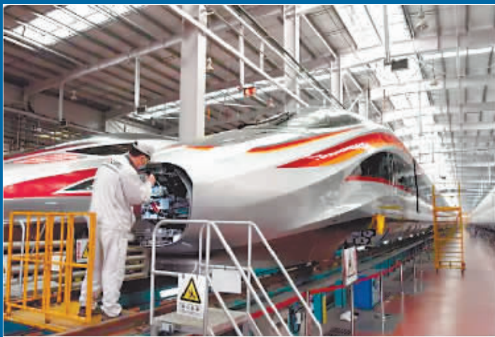
技术人员在查看“复兴号”智能动车组。