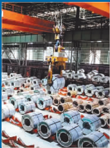
西昌钢铁有限公司板材车间。