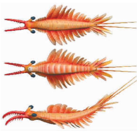
帽天山开拓虾三维艺术复原图。

科研人员还对帽天山开拓虾进行了演化分析。结果表明，它已经非常接近奇虾类群的演化起点。“这项研究为追溯奇虾这类动物的起源以及整个寒武纪早期的生命演化提供了重要新证据。”领导此项研究的赵方臣研究员说。