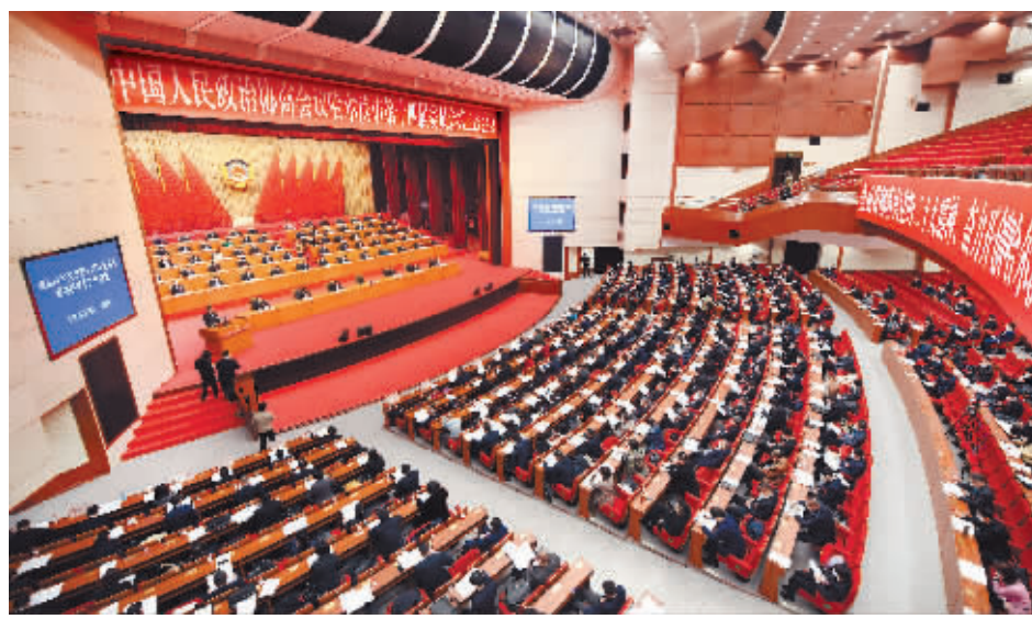
1 月 4 日,政协哈尔滨市第十四届委员会第二次会议在哈尔滨国际会议中心环球剧场隆重开幕。

会议强调,要强化理论武装,夯实共同思想政治基础。要扛起团结奋斗的历史责任,为新时代新征程凝聚力量。要聚焦党委政府中心任务,提高协商议政质量。要改进民主监督,助推决策部署落实。要有效发挥界别作用,进一步激发界别活力。要切实加强自身建设,提高履职能力和水平。