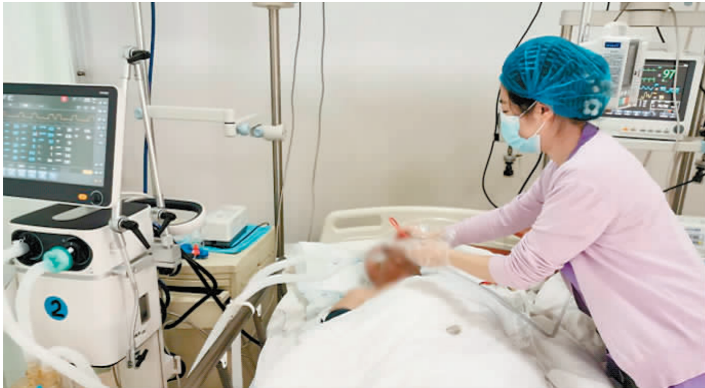
医护人员悉心守护重症患者。

此外,市第四医院还统筹调度急救资源,提前采购生命支持设备,做好设备、物资和药品保障工作,保证重点病区重点患者的救治需要。