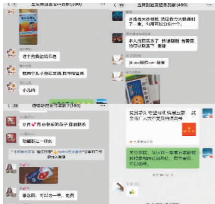
邻居们在微信群中分享药品。

通过整合社区村屯就医网管理力量,依托互助群打造“互助圈”,五常市充分发挥党员模范带头作用,织成一张互助网,最大限度发挥药品效能,让“邻里守望、温暖相助”成为冬天的暖阳。