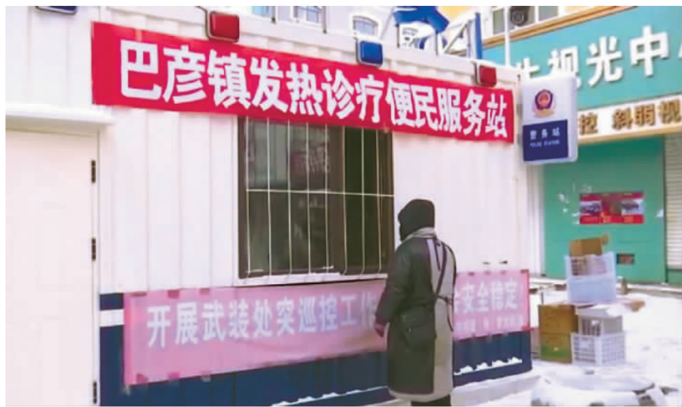
居民在服务站取药。

下一步,巴彦县卫健局将继续加大“便民医药包”包装、发放力度,向乡镇卫生院、村卫生室投放“便民医药包”5000份(人),用以解决基层群众的用药需求,有效推进分级诊疗机制,缓解二级医疗机构发热门诊的就诊压力。