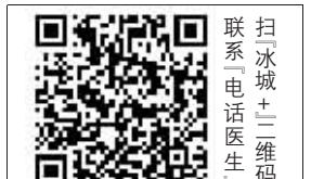
扫冰城+二维码 联系电话医生

本报讯(王天航 记者 罗彦坤)为切实做好分级诊疗,扩大基层医疗服务延伸的深度与广度,近日,巴彦县开通“电话医生”线上用药咨询服务,引导轻症患者就近就医或居家治疗监测。 为方便广大居民群众新冠肺炎诊疗咨询,巴彦县卫健局提醒广大居民履行个人防控责任,提高防护意识,遵守防控要求,共同筑牢疫情防控屏障。 表示,“电话医生”都是从县医院、乡镇卫生院医生中选出,具备医资质和丰富的发热诊疗经验,此项服务开通,方便区内患者对接医生,更为重症患者就近就医提供了便利。同时,巴彦县卫健局提醒广大居民履行个人防控责任,提高防护意识,遵守防控要求,共同筑牢疫情防控屏障。 巴彦县卫健局相关负责人