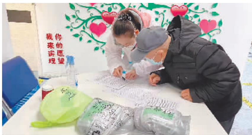
工作人员发放“暖心防疫包”。

社会工作者、志愿者、社会慈善资源,全力协助做好重点人群健康服务和生活保障工作,切实保护人民群众生命安全。 12月15日,平新街道秀水社区(新华