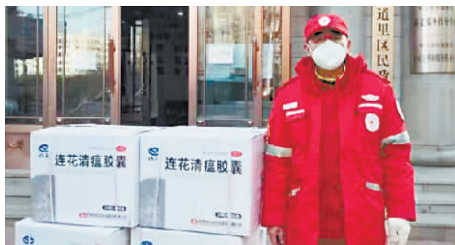
右图:红十字志愿者运送药品。

送达6区民政部门;市直机关工委协调哈药集团爱心捐赠维生素C和维生素E各1万盒,相应药品陆续汇集各区后,由各乡镇(街道)送到困难群众手中,确保社会救助对象“困有所帮、难有所助”。 据了解,各区县(市)民政局也将根据本地实际情况,多渠道多形式筹集物资开展救助关爱,搭配组合“基本生活包”“健康医药包”“暖心防疫包”“节日问候包”等,并结合实际情况做成各种“组合包”,满足困难群众实际需求,用心践行为民解困服务宗旨,将关心关爱送到困难群众身边。