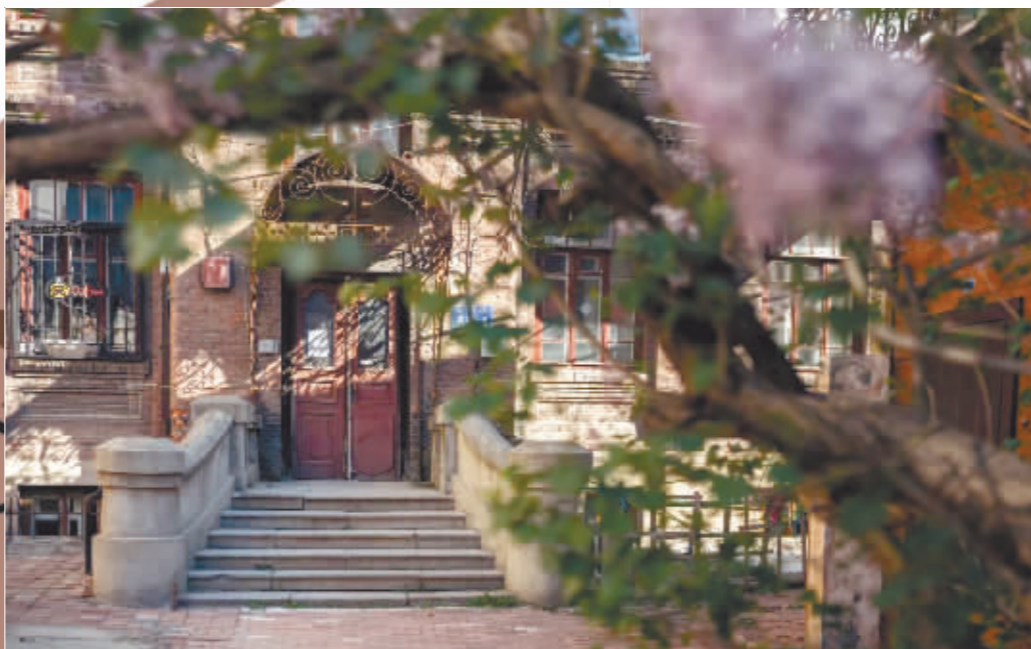
丁香树掩映下的戈雅咖啡馆。

2021年7月,明星范丞丞来到哈尔滨专程到戈雅咖啡馆拍照打卡,并在戈雅咖啡馆拍摄完成了一条vlog,视频一经推出就有146万的观看量,“范丞丞咖啡馆复古”“哈尔滨小巷内的咖啡馆”等词条也频频登上热搜。如今,戈雅咖啡馆已经成为外地游客来中央大街必打卡点,成都、北京、上海、广东、郑州等全国各地游客慕名来到老房子里的咖啡馆,享受这里的“慢时光”。