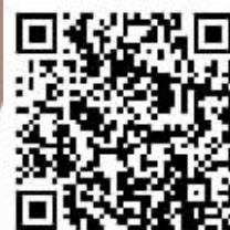
扫“冰城+”二维码 观看视频