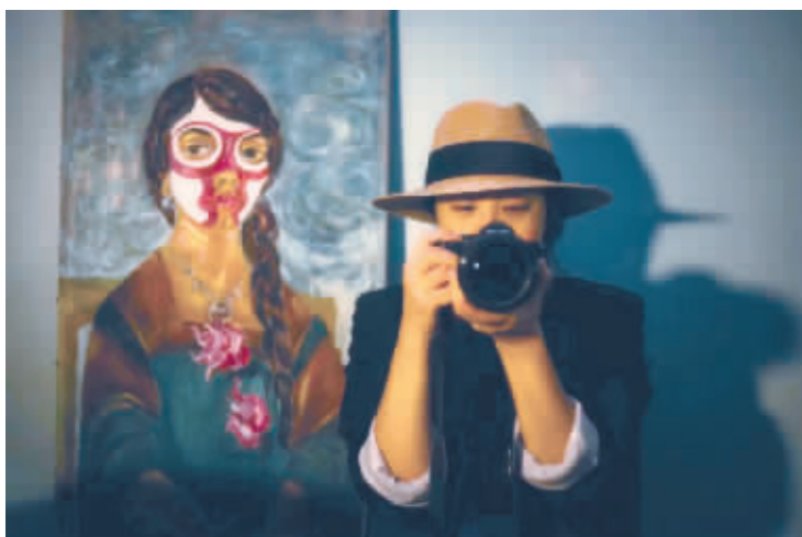
爱好摄影和艺术的戈雅。