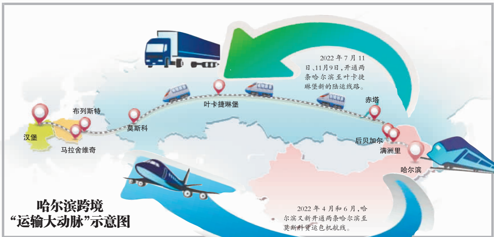
哈尔滨跨境“运输大动脉”示意图

哈尔滨海关数据显示,今年前10个月,黑龙江省货物贸易进出口总值2115.6亿元人民币,已经超过去年1995亿元的全年总值,进出口增速居全国第6位。越来越多的中国品牌从哈尔滨开始它们的“全球之旅”。