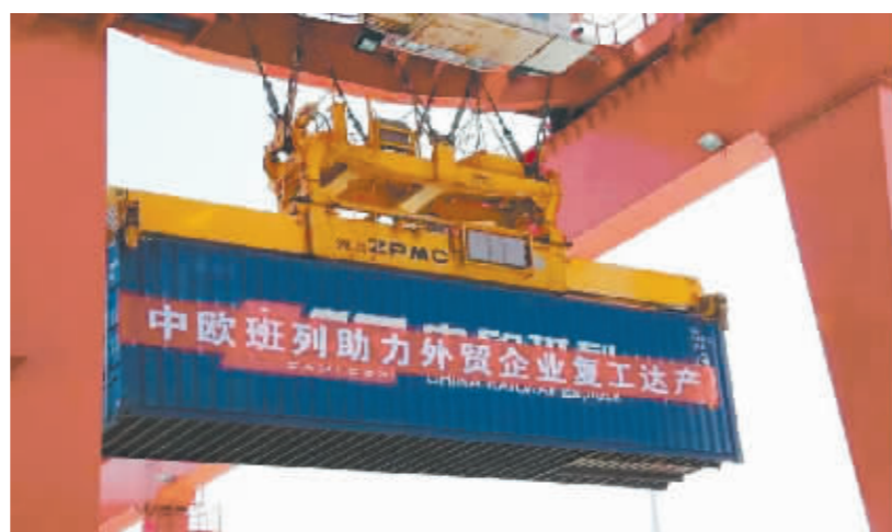
出口集装箱搬运中。