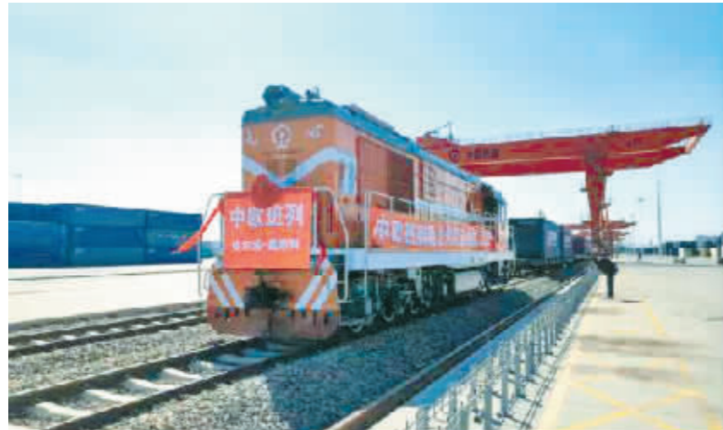
哈欧班列从哈尔滨香坊火车站开出。

哈尔滨海关数据显示,今年1月到10月,哈尔滨关区监管进出境中欧班列728列,6.86万标箱,同比分别增长66.6%和72.3%。