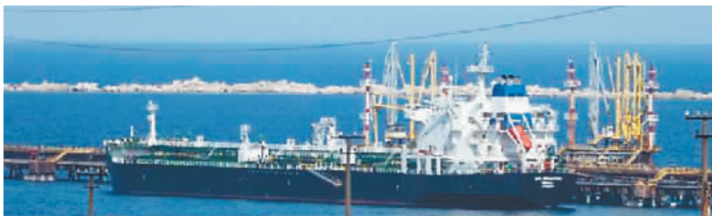
2022年5月31日,一艘油轮停靠在位于意大利南部西西里岛的ISAB炼油厂码头。ISAB由俄罗斯跨国能源公司卢克石油公司持有。

爱沙尼亚总理卡拉斯表示,价格上限在30至40美元间,才会对俄罗斯造成实质性伤害。“然而,60美元已经是我们能得到的最好结果。”