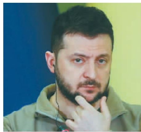
乌克兰总统泽连斯基。

泽连斯基称,如果俄油价格上限是60美元,而不是波兰和波罗的海国家讨论的数字,比如30美元,那么俄罗斯每年仍将赚进约1000亿美元。