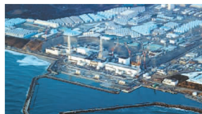
日本福岛第一核电站。

中新网消息 据日本共同社报道,东京电力公司将近期暂停挖掘福岛第一核电站核污水排海用的海底隧道。日本政府和东电力争的“明年春季前后”启动排海,很可能推迟至夏季以后。东电今年8月全面启动核污水的排放设备工程,截至12月2日已在海底挖掘了约780米,在挖到约800米的阶段将暂时停工。 报道称,约1公里的隧道虽挖掘了8成左右,但需要优先排出口周边的工程。重启挖掘时间将在明年4月前。 在此期间,将对设置在近海底隧道出口的混凝土制“沉箱”周边,进行混凝土等加固工程。预计需花费约4个月,但根据天气和海况也可能推迟。利用停工期,排放时注入处理水的竖井内部墙面工程也将提前实施。 据悉,在两个工程结束的明年4月前,将重启隧道的挖掘工程,剩下约200米将用2至3个月时间完成。 2011年3月11日,日本东北部海域发生9.0级地震并引发特大海啸。受地震、海啸双重影响,福岛第一核电站大量放射性物质泄漏。2021年4月13日,日本政府正式决定将福岛核污水经过滤并稀释后排入海,但这一决定遭到国际社会广泛质疑和反对,在日本国内也引发强烈担忧。