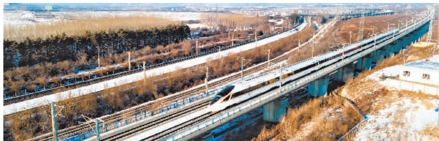
行驶中的哈大高铁列车。

本报讯(记者 刘希阳)记者从中国铁路哈尔滨局集团有限公司获悉,12月1日,世界首条高寒高速铁路哈尔滨至大连高速铁路,迎来开行十周年纪念日,哈大高铁是我国高寒地区客流量最大、最繁忙、运行里程最长的高速铁路,十年来全线累计安全运送旅客6.7亿人次,为满足人民群众对美好旅行生活的向往、保障国民经济平稳运行提供强力支撑。