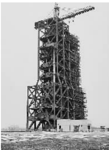
神舟十五号火箭组合体。

神舟十五号载人飞船于11月29日晚间在酒泉卫星发射中心成功发射升空,创下了我国在超低温天气成功发射载人飞船的新纪录。