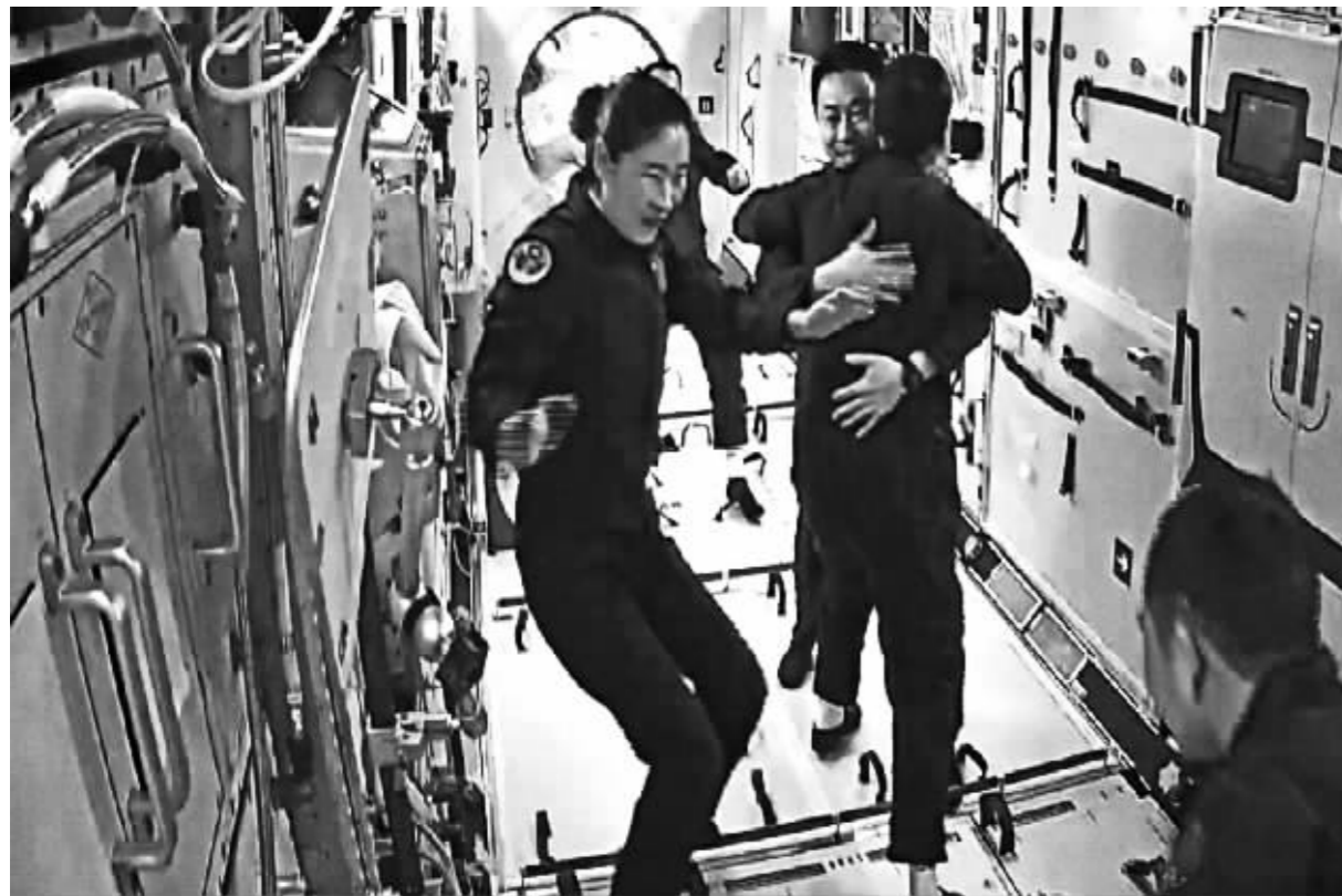
神舟十四号航天员刘洋、蔡旭哲在问天实验舱迎接神舟十五号航天员乘组。

中国第十艘载人飞船在极寒严寒的西北戈壁星夜奔赴太空,神舟十五号航天员乘组于11月30日清晨入驻“天宫”,与神舟十四号航天员乘组相聚中国人的“太空家园”,开启中国空间站长期有人驻留时代。