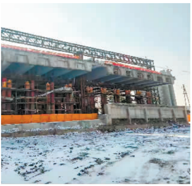
东三环快速路化工路段原桥梁顶升工作完成。

施工前,市住建局针对既有桥梁现状情况与结构形式,成立技术攻关小组,从力学行为研究、关键技术研究、基于数字孪生