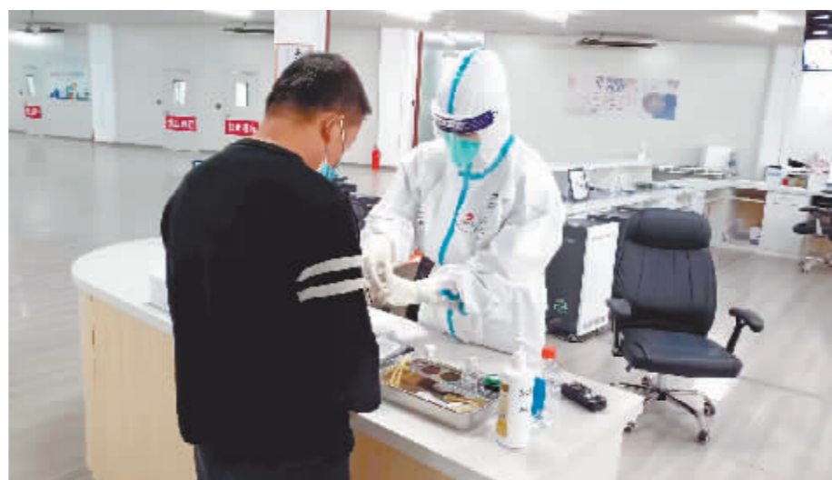
尽心尽力为患者提供服务。

“看到每天都有患者出院,看到他们恢复健康我们就很高兴。很多患者给医护人员写了感谢信,听到一声声发自内心的