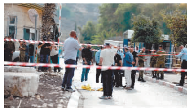
11月15日,人们聚集在约旦河西岸城镇塞勒菲特一定居点附近的袭击现场。约旦河西岸当天发生一起袭击事件,目前已造成4人死亡。