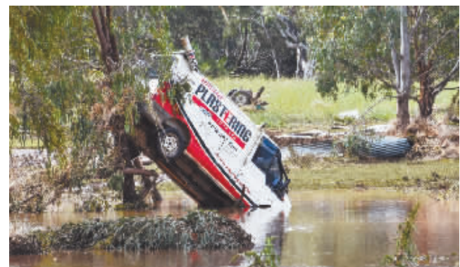
澳大利亚东南部多地连日遭遇暴雨及洪灾,河流水位激增,洪水冲垮桥梁、侵袭农场和民宅,造成人员被困。