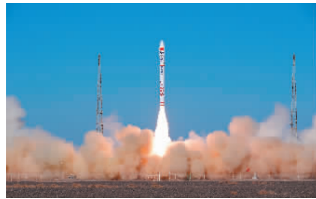
11月16日14时20分,谷神星一号遥四运载火箭在我国酒泉卫星发射中心成功发射升空,将搭载的5颗吉林一号高分03D卫星顺利送入预定轨道,发射任务获得圆满成功。