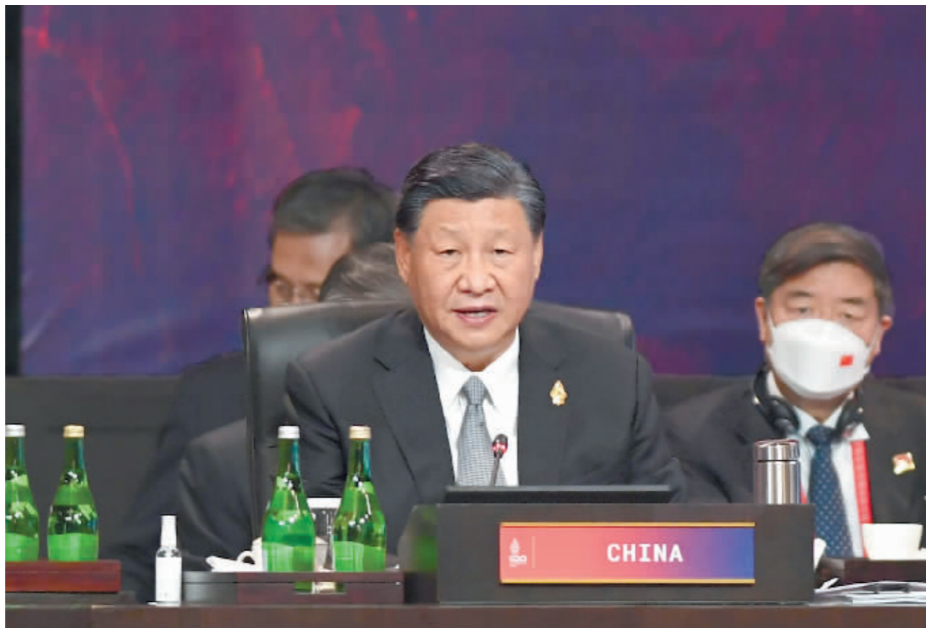
当地时间11月16日,二十国集团领导人第十七次峰会在印度尼西亚巴厘岛继续举行。国家主席习近平出席并发言。

中方提出了《二十国集团数字创新合作行动计划》,旨在推动数字技术创新应用,实现创新成果普惠共享,欢迎各方积极参与。中方愿继续同二十国集团成员合作,携手构建普惠平衡、协调包容、合作共赢、共同繁荣的全球数字经济格局。