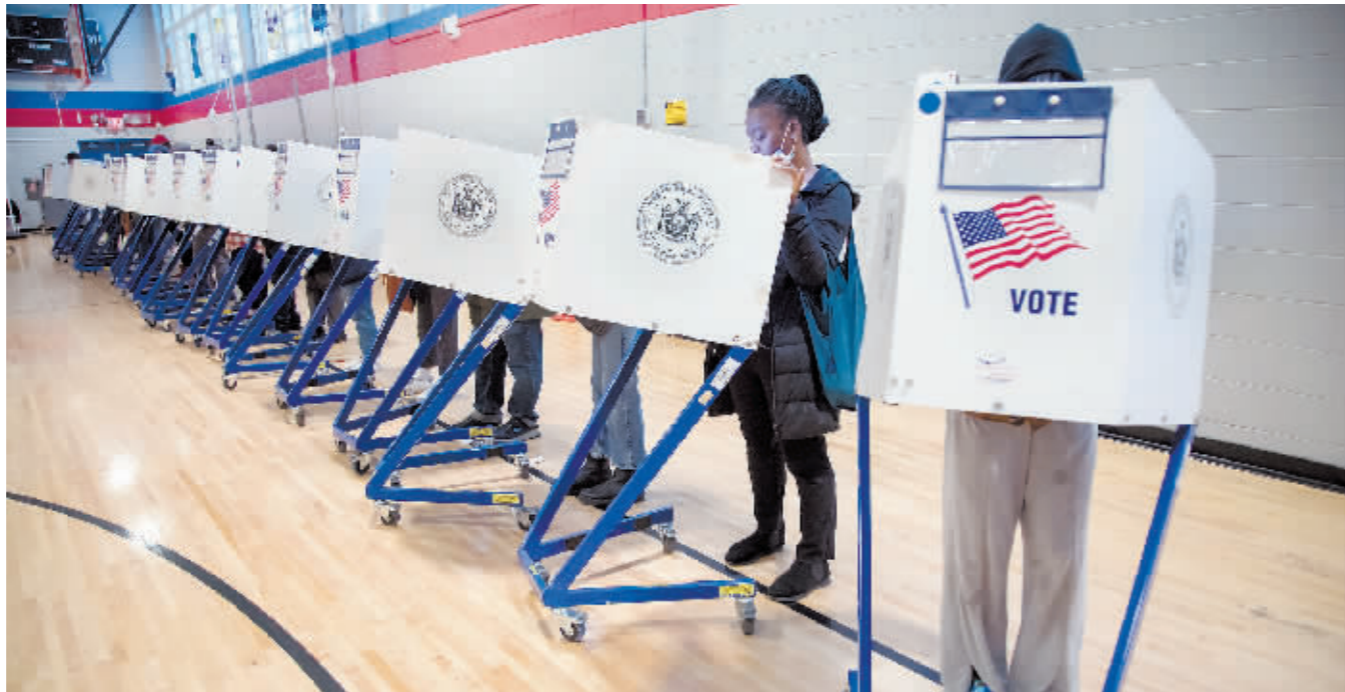
11月8日,选民在美国纽约的一处投票站参加中期选举投票。

目前,在参议院100个席位中,民主党人获得50个席位,共和党人获得49个席位。民主党人凭借副总统、参议院议长哈里斯的一票已经提前锁定参议院多数党。此外,剩下的一个佐治亚州参议员席位将在12月6日通过决选产生。