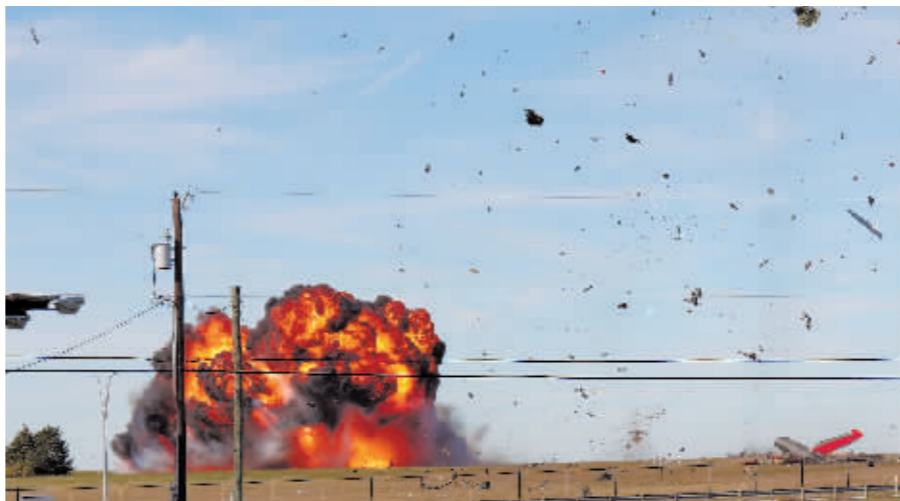
11月12日,在美国得克萨斯州达拉斯,参加“飞越达拉斯之翼”航展的两架飞机相撞后爆炸。

美国先前多次发生军用“老爷机”坠毁事件。2011年,一架P-51“野马”战斗机在内华达州里诺市一次飞行比赛中撞向观众,导致11人死亡。2019年,一架B-17轰炸机在康涅狄格州哈特福德坠毁,7人丧生,6人受伤,飞机维护不足是事故原因之一。美国国家运输安全委员会同年说,1982年以来已经调查21起涉及二战时期轰炸机的事故,共计23人死亡。