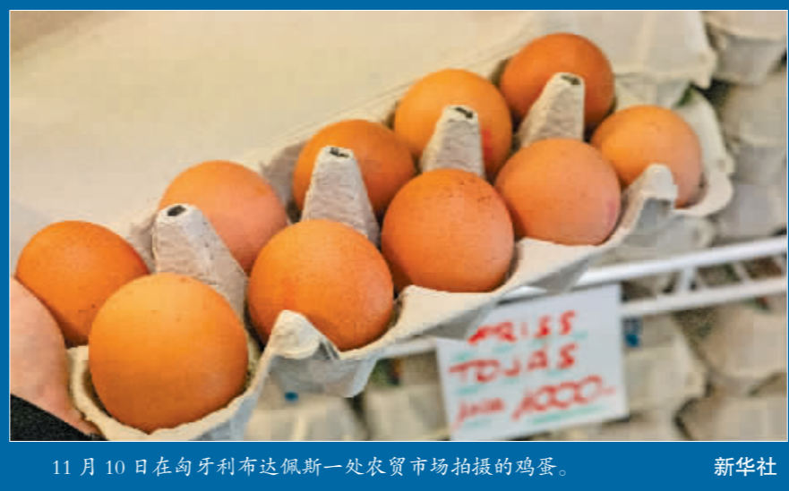
11月10日在匈牙利布达佩斯一处农贸市场拍摄的鸡蛋。