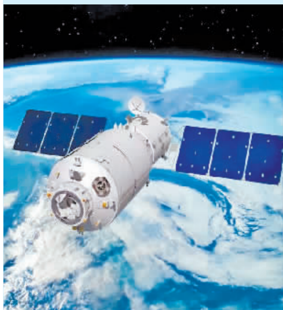
天舟四号货运飞船示意图。

记者从中国载人航天工程办公室了解到,11月9日14时55分,已完成既定任务的天舟四号货运飞船,顺利撤离空间站组合体,转入独立飞行阶段。