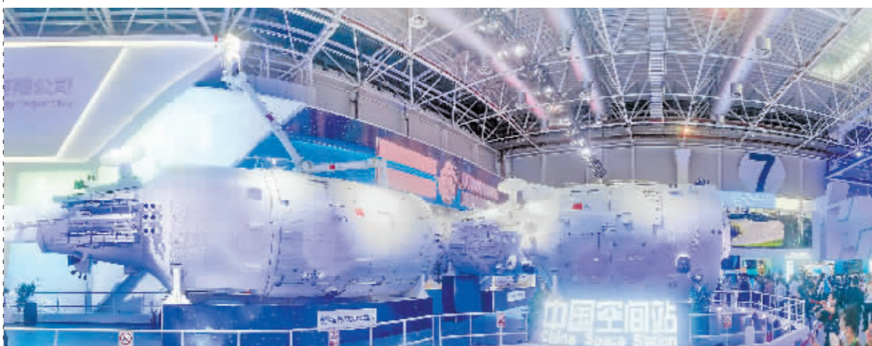
观众在第十四届中国航展参观中国空间站组合体展示舱。

第十四届中国航展上,中国空间站组合体1:1展示舱成为一大“打卡”点。记者此前通过航展探展看到,展位全景展示空间站T字基本构型,包括天和核心舱、问天实验舱、梦天实验舱三舱。