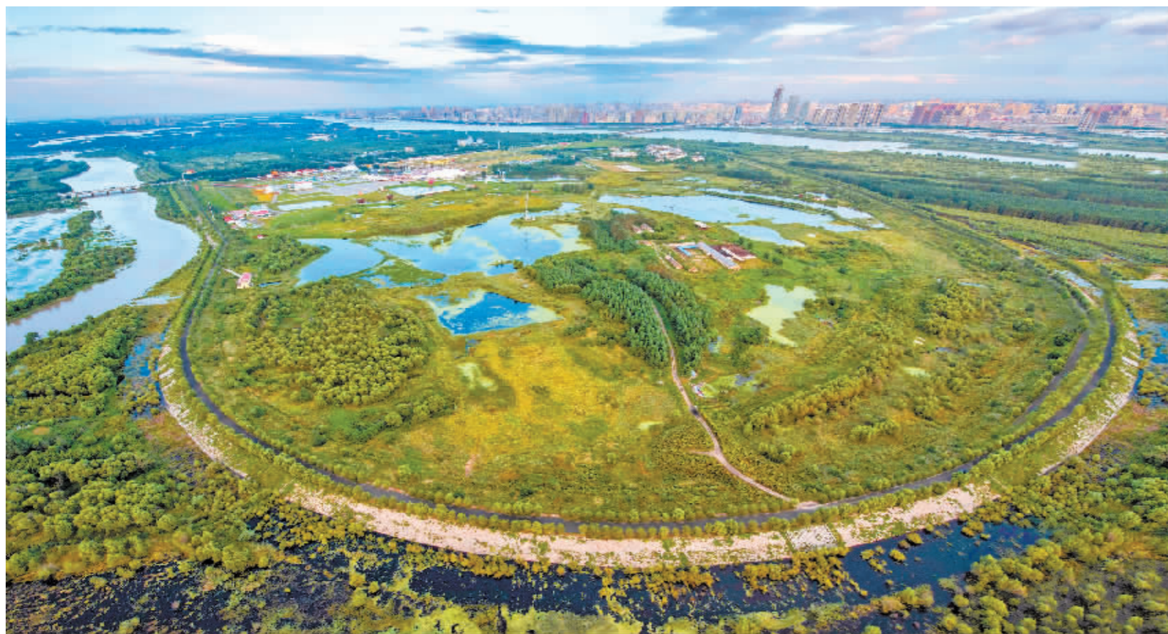
哈尔滨太阳岛西区外滩湿地公园。