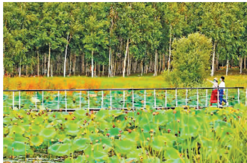
9月冰城,哈尔滨大剧院湿地秋色初染,碧绿的荷叶、金色的莲蓬与岸边的各色花草相映成趣。

汪金铭说:“我们的摄影师拍湿地更爱湿地,以景深传递情深,用自己的方式描绘哈尔滨大美湿地的精彩画卷。”