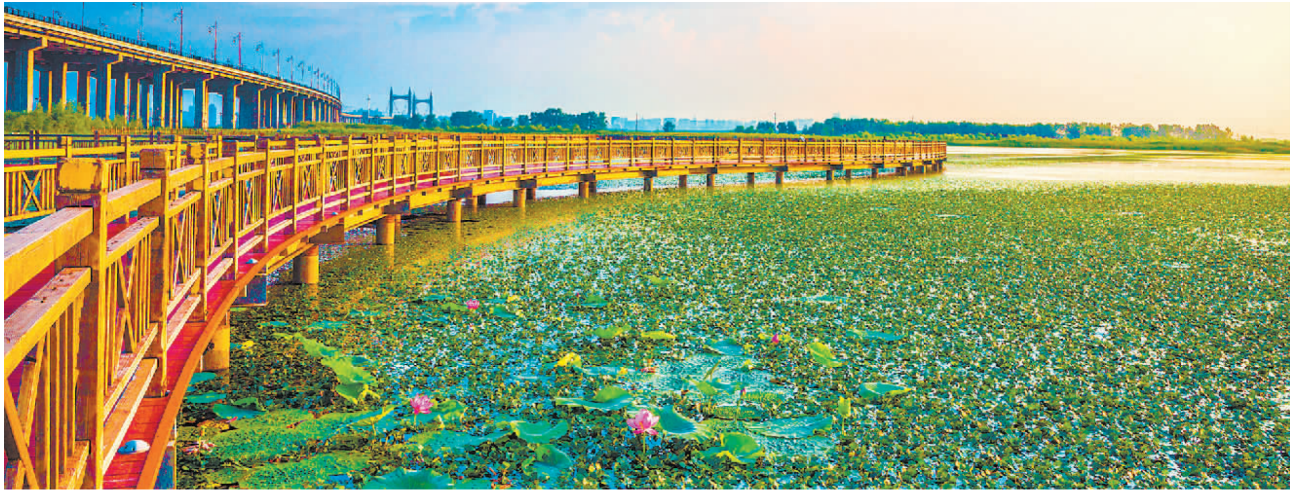
晨曦中的阳明滩湿地绿意葱茏,风景如画。