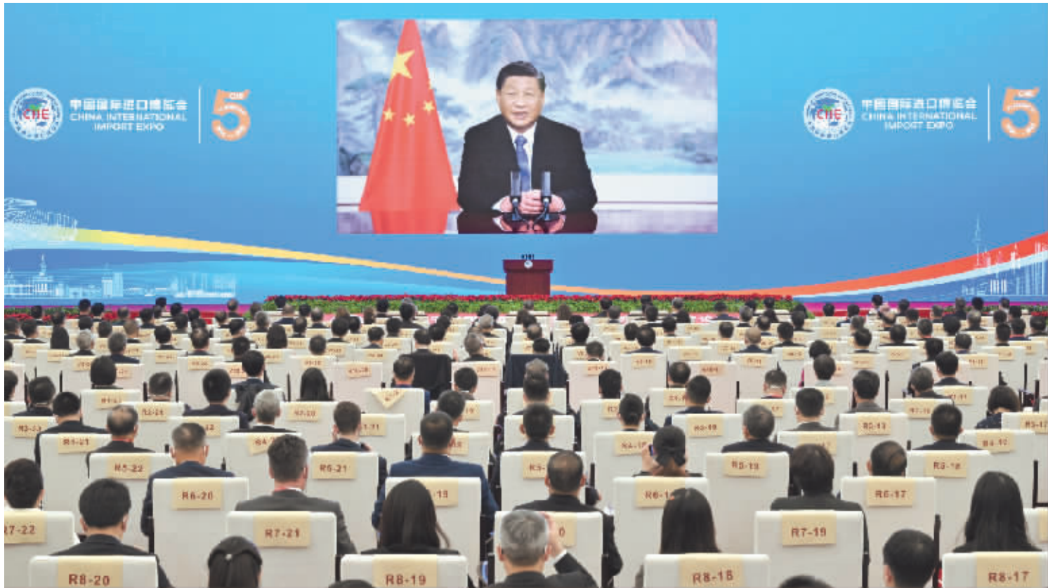
11月4日晚,国家主席习近平以视频方式出席在上海举行的第五届中国国际进口博览会开幕式并发表题为《共创开放繁荣的美好未来》的致辞。

新华社北京11月4日电 11月4日晚,国家主席习近平以视频方式出席在上海举行的第五届中国国际进口博览会开幕式并发表题为《共创开放繁荣的美好未来》的致辞。