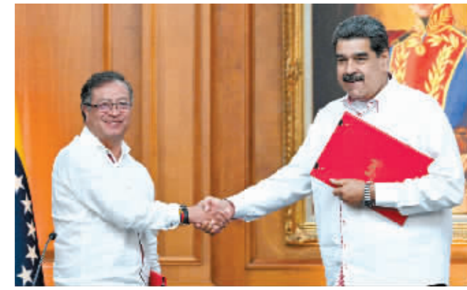
马杜罗(右)与哥伦比亚总统佩特罗握手。

据新华社电 哥伦比亚总统古斯塔沃·佩特罗1日访问委内瑞拉首都加拉加斯并与委总统尼古拉斯·马杜罗会面,修复这两个拉美邻国疏远多年的关系。