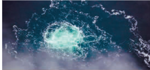
“北溪”气体泄漏现场。

今年9月底,连接俄罗斯和欧洲的重要天然气管道“北溪-1”和“北溪-2”接连出现气体泄漏和下水下爆炸。多方表示管道遭“蓄意破坏”的嫌疑较大。10月29日,俄罗斯国防部通报称“根据现有信息”,英军参与了策划实施破坏“北溪”天然气管道。英国国防部随即否认了俄方的说法。