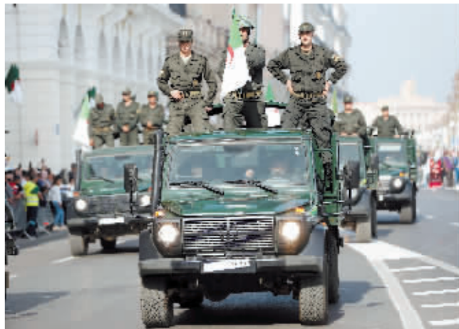
10月31日,阿尔及利亚在首都阿尔及尔举办国庆日庆祝活动。11月1日是阿尔及利亚国庆日。