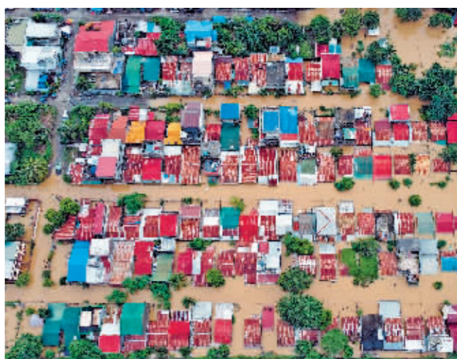
这是10月31日在菲律宾伊拉甘拍摄的风暴过后的受灾景象。菲律宾民防局11月1日发布通报说,热带风暴“尼格”在多地引发洪水和山体滑坡,造成的死亡人数已上升至132人。