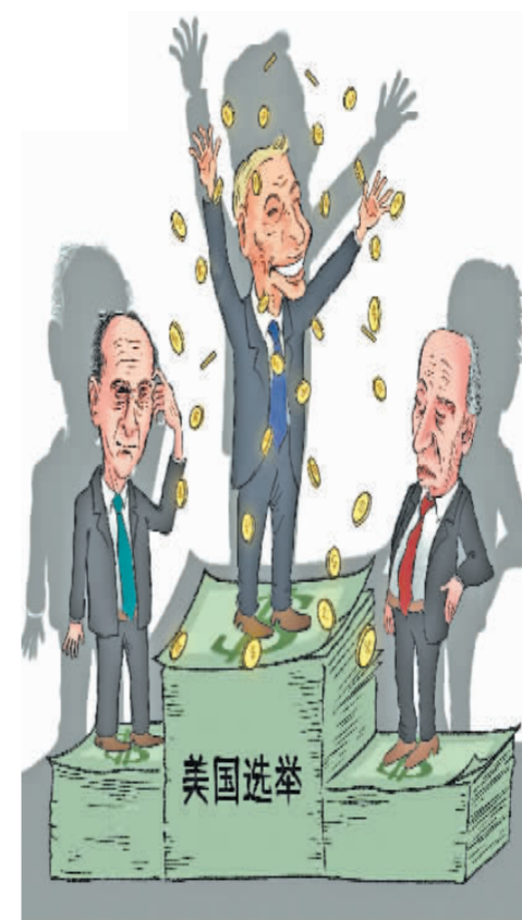
假面之下,“金钱至上”才是美国民主始终不变的本质。正如英国曼彻斯特大学社会学教授加里·扬所言,无论美国选民投票给谁,“赢家总是金钱”。 (新华社北京11月1日电)

权谋私的腐败问题并非个例。《纽约时报》近期发布的一份调查报告指出,至少有97名现任国会议员涉嫌利用职权提前获取内幕消息,据此买卖股票、债券或其他金融资产。多年来,媒体曝光了很多政客腐败案例,但问题始终得不到真正解决。这说明,症结并不在个别政客的贪婪,而在美国民主本身。美国精心设计的选举制度,并非是为服务于最广大人民,而是把人民割裂为不同群体,使之相互争斗、无法团结,从而让统治阶层更方便地进行统治。各政党的活动离不开资本所提供的资金,离不开资本所掌控的媒体,离不开资本所塑造的价值观,也摆脱不了资本游说的影响。更不用说,很多高层人士通过“旋转门”往来于政商两界,本身就是“亦官亦商”。因此,这些政客不可能真正代表民众利益,国家权力始终稳稳攥在资本家手中。美国普林斯顿大学教授马丁·吉伦斯和西北大学教授本杰明·佩奇在联合撰写的《美国有民主吗?哪里出了问题,我们能做什么》一书中写道:“美国经济精英阶层和利益团体对美国政策有巨大影响力,而普通美国人几乎没有影响力。”《纽约时报》与美国西恩纳学院今年7月联合民调显示,58%的美国选民认为,“美国的政治体制已经崩溃,需要进行结构性改革”。1863年,时任美国总统林肯在葛底斯堡演说中以“民有、民治、民享”来形容理想中的美国民主政府。150多年后的今天,新加坡国立大学亚洲研究所杰出研究员马凯硕在其著作《亚洲的21世纪》中借用并改造了这一表述:“事实表明,美国已远离民主而走向财阀统治,其社会是‘1%有、1%治、1%享’。”