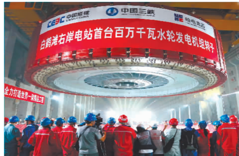
“奋进新时代”主题成就展参展图片:哈产的百万千瓦水轮发电机组转子吊装现场。