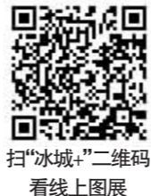
扫“冰城+”二维码 看线上图展