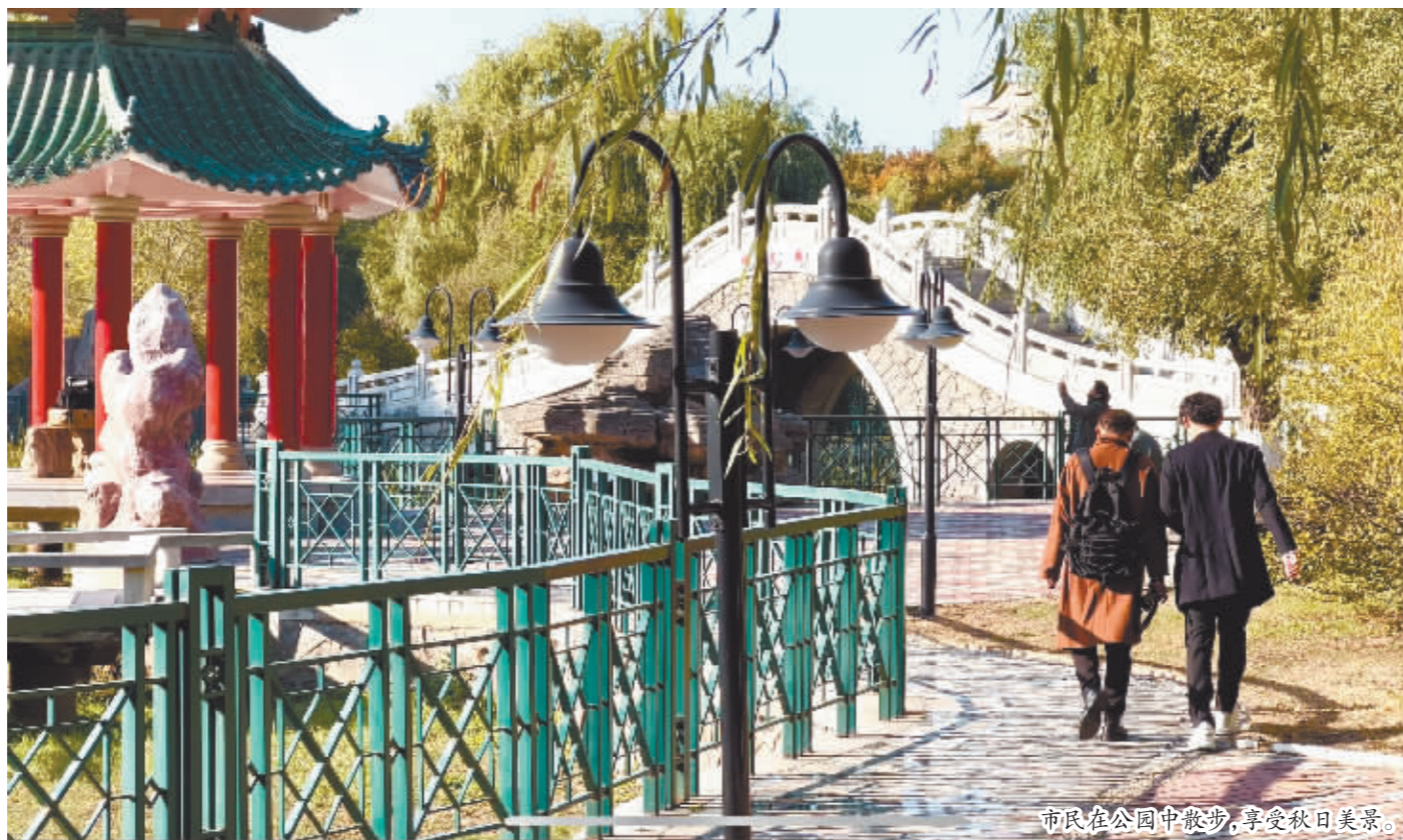
市民在公园中散步,享受秋日美景。