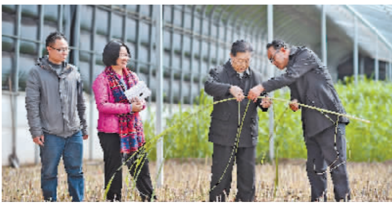
在宁夏银川市,福建农林大学教授(右二)与农户交流菌草种植技术。

电视剧《山海情》中,小小的双孢菇远销外地,助力闽宁镇村民走上致富路。现实中,双孢菇已经从村民家的小作坊搬到了智能化厂房,