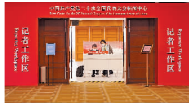
这是10月12日拍摄的记者工作区。

新华社北京10月12日电 10月12日,中国共产党第二十次全国代表大会新闻中心正式开始对外接待服务,为境内外记者采访二十大提供服务保障。