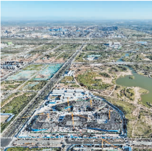
这是建设中的中国卫星网络集团有限公司(简称中国星网)雄安新区总部大楼。

2022年7月25日,中国矿产资源集团有限公司正式揭牌,成为又一家注册落户河北雄安新区的中央企业。