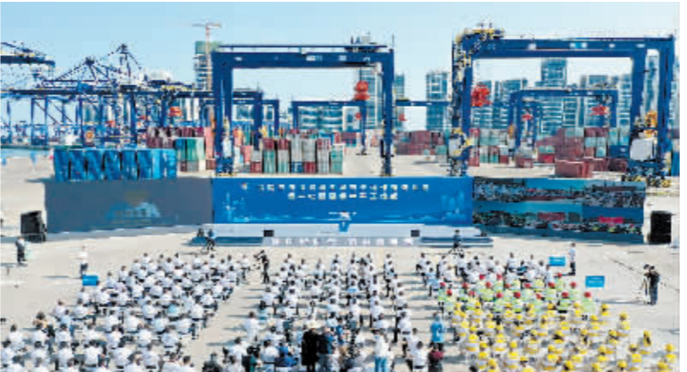
这是海南自由贸易港全岛封关运作建设项目开工仪式现场。

大江大河由于行政管理分割,一直是治理难题。新安江的绿色转型之路,彰显了中国特社会主义