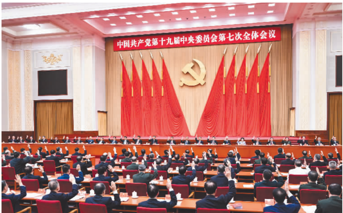
中国共产党第十九届中央委员会第七次全体会议,于2022年10月9日至12日在北京举行。中央政治局主持会议。