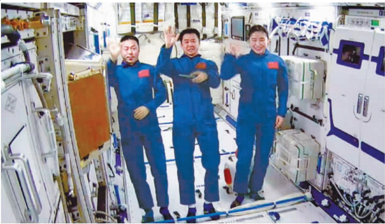
图为神舟十四号航天员陈冬(中)、刘洋(右)、蔡旭哲在问天实验舱。

记者11日从中国载人航天工程办公室获悉,“天宫课堂”第三课定于10月12日15时45分开始,神舟十四号飞行乘组航天员陈冬、刘洋、蔡旭哲将面向广大青少年进行太空授课。