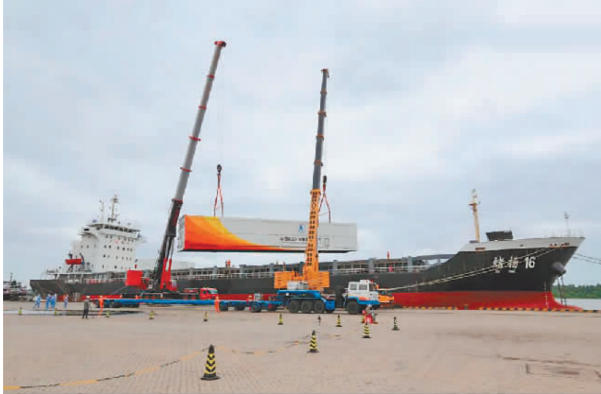
图为长征七号遥六运载火箭运往发射场。

目前,执行上述任务的飞行产品均已进场,文昌航天发射场2箭2舱(船)同时在场区进行测试,酒泉卫星发射中心同步开展载人飞船发射和回收任务准备,测控通信系统陆海天接力、全天候值守保障空间站安全稳定运行,神舟十四号航天员在轨“出差”时间过半,神舟十五号乘组正在加紧训练,各项空间科学实验扎实稳步推进、取得阶段性成果。