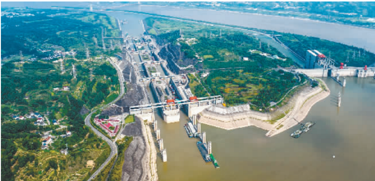
图为船舶有序通过三峡五级船闸。

重大水利工程,已开工30项;江西大别山区等6项新建大型灌区已开工,将新增和改善灌溉面积645.5万亩。