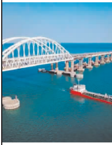
克里米亚大桥资料图。

此前,乌克兰国家安全与国防委员会秘书达尼洛夫也表示,如果俄罗斯通过克里米亚大桥的路线增援物资和装备,一旦出现机会,乌克兰一定会攻击克里米亚大桥。