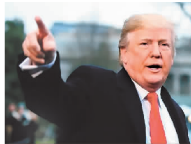
美国前总统特朗普。

中新网消息 当地时间3日,美国前总统特朗普对美国有线电视新闻网(CNN)提起诉讼,并要求4.75亿美元的惩罚性赔偿。