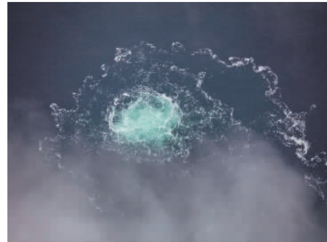
瑞典海岸警卫队发布的照片显示“北溪”管道第四个泄漏点。

据新华社电 瑞典检察院3日宣布封锁“北溪”天然气管道泄漏点附近海域,并展开刑事调查。