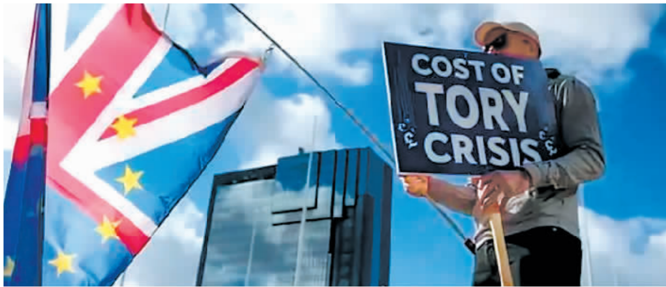
保守党年度秋季会议会场外,一名抗议者举着标语牌,上面写着“保守党危机的代价”。