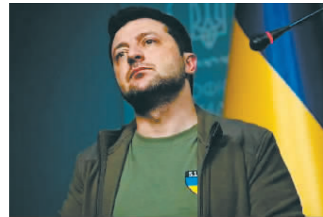
乌克兰总统泽连斯基。

中新网消息 10月4日,乌克兰总统泽连斯基签署法令,批准了乌克兰国家安全和国防委员会关于不可能与俄罗斯总统普京进行谈判的决定。