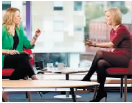
特拉斯2日接受媒体采访。

而如今,还没等财政大臣克沃滕宣布放弃对高收入人群减税,仅仅只是3日一大早有消息传出,英镑对美元汇率就从1.1092涨到了1.1240。