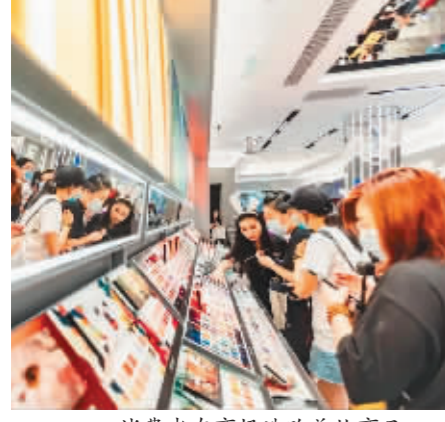
消费者在商场选购美妆商品。