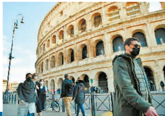
人们走过意大利罗马斗兽场。