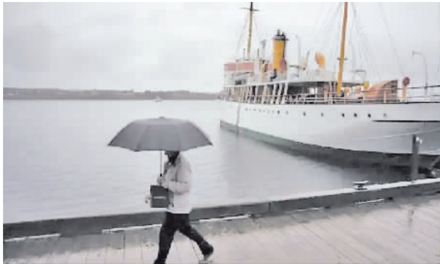
当地时间23日,在飓风登陆之前,一名行人在海滨用雨伞遮挡自己。

据新华社电 加拿大气象部门23日说,横扫加勒比和百慕大地区的飓风“菲奥娜”预计于24日早上登陆加拿大东部,可能成为该国史上遭遇的最强风暴之一。加拿大环境部说,“菲奥娜”预计将在新斯科舍省布雷顿角岛登陆。届时“菲奥娜”可能减弱为风暴,但依然破坏力十足,有望带来大风、暴雨和巨浪。加拿大飓风中心气象学家伊恩·哈伯德说,“菲奥娜”将成为“具备飓风级别风速、巨大强劲的后热带气旋”,“这肯定会成为加拿大东部史上最强大风暴之一”。另一名气象学家鲍勃·罗比肖说,“菲奥娜”有望写入加拿大历史,成为与2003年“胡安”和2019年“多里安”相提并论的飓风。加拿大东部沿海的新斯科舍省、爱德华王子岛省、纽芬兰省可能成为受影响最大的地区。三省都发布警报,提醒居民避免外出,备足至少3天的生活物资。