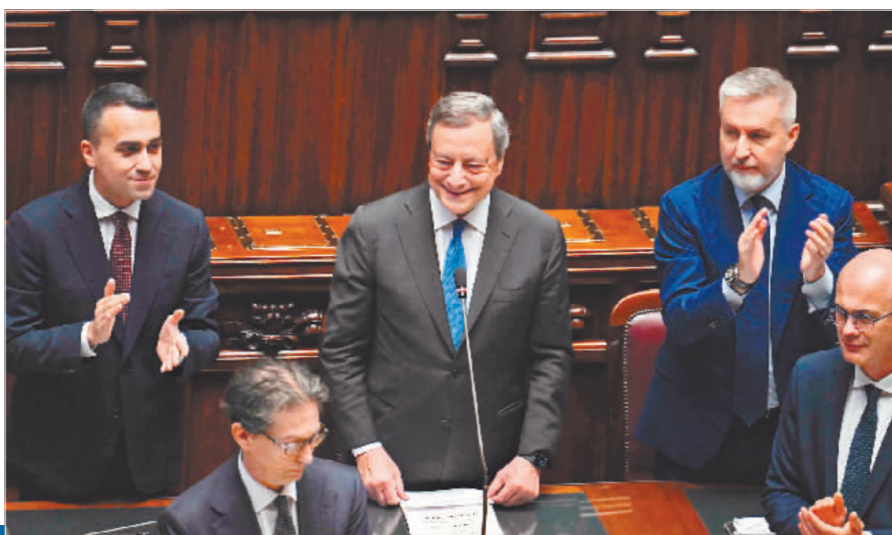
7月21日,在意大利罗马,意大利总理马里奥·德拉吉(中)抵达众议院。

意大利议会选举定于25日举行。最新民调结果显示,由意大利兄弟党、联盟党和意大利力量党组成的中右翼联盟支持率约为47%,由民主党领导的中左翼联盟支持率约为28%,五星运动党支持率约为13%。在新冠疫情和乌克兰危机背景下,参加选举的各党派在推动经济复苏、处理非法移民和难民问题、协调与欧盟关系三大议题上的立场受到外界普遍关注。