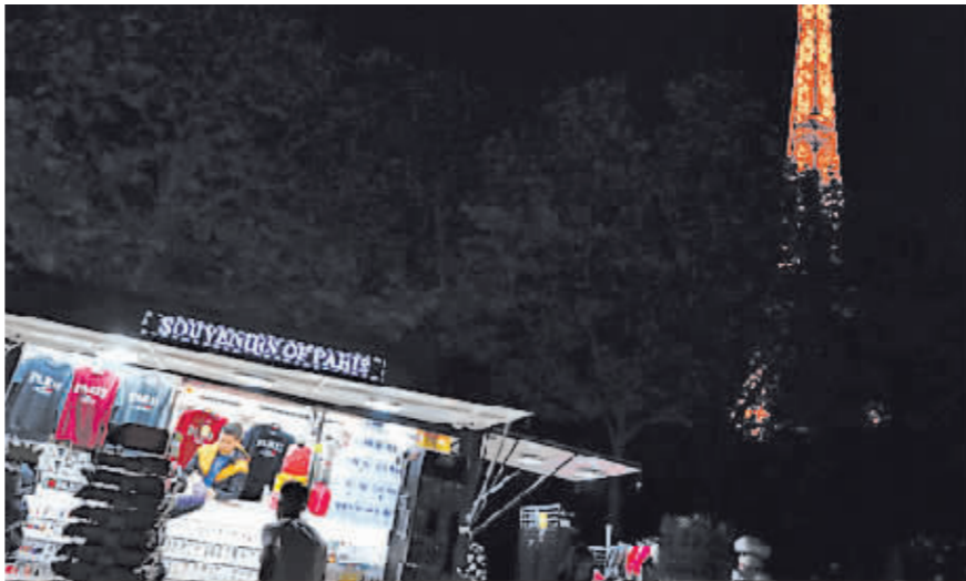
熄灯前的埃菲尔铁塔和附近的一家纪念品商店。

据新华社电 从23日开始,包括埃菲尔铁塔在内的巴黎多个地标建筑提前停止夜间装饰性照明。为应对能源危机,法国推出的节能计划令繁华的“夜巴黎”变得暗淡很多。根据巴黎市政府不久前宣布的节能计划,从23日起,埃菲尔铁塔熄灯时间由以往的次日1点提前至23点45分。巴黎的其他一些地标建筑,如市政厅、圣雅克塔、部分博物馆和所有区政府办公楼的熄灯时间全部提前,即从晚上10点起关闭外观装饰性照明。23日晚,记者在铁塔脚下看到,23点45分时间一到,刚刚还灯火通明、巍峨矗立的铁塔立刻漆黑一片,陷入沉沉黑夜之中。铁塔旁战神广场上聚集的游客发出阵阵遗憾的叹息声。据《巴黎人报》报道,巴黎市长伊达尔戈13日宣布,为应对能源危机,巴黎市政府推出紧急节能计划,旨在实现法国总统马克龙提出的节能10%的目标。巴黎除了地标建筑提前熄灯外,备受关注的措施还包括计划市政建筑冬季室内温度下调和香榭丽舍大街的“圣诞灯饰”仪式提早结束。法国电视台23日说,将在旗下一些频道实时播放“电力地图”,显示全国的用电情况,电力紧张的地区会用红色标注,提醒民众减少用电或错峰用电。埃菲尔铁塔表示,“人们可能得在22时而不是19时用洗衣机。”法国媒体指出,受俄乌冲突的影响,近几个月来能源价格大幅上涨,法国不得不通过节能措施来应对能源危机。法国总统马克龙此前曾呼吁全国通过各种节能措施,减少能源消费,努力实现节能10%的目标,避免冬季出现能源定量配给或者中断的危险。