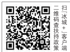
扫二维码+客户端 二维码查扶持政策

日前,哈市多个部门联合网络平台召开网络经营平台企业扶持政策暨个体工商户服务月工作对接会议,就平台企业服务支持个体工商户发展,为哈尔滨个体工商户入驻